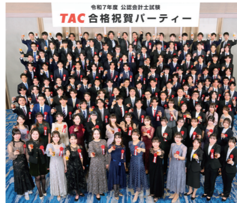
公認会計士試験 2025年度 合格祝賀パーティー 東京会場 ホテルメトロポリタンエンドモント