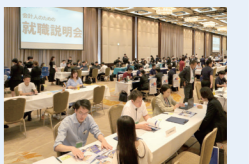
会計士のための就職説明会(東京会場・2025年8月開催)

会計業界専門の採用イベントとして、会計事務所・法人と会計業界を志す人材との交流機会を提供しています。